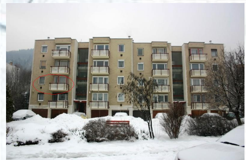
Az ingatlanról készült fénykép

Az épület összesített energetikai jellemzője az épület rendeltetésszerű használatának feltételeit biztosító épületgépészeti rendszerek egységnyi fűtött térfogatra vonatkozó, primer energiában kifejezett, kWh/(m 2 a) mértékegységű éves fogyasztása. Az összesített energetikai jellemző tartalmazza a fűtési, légtechnikai, melegvízellátási és (a lakóépületek kivételével) a világítási rendszereinek fogyasztását, beleértve a rendszerek hatásfokát és önfogyasztását.