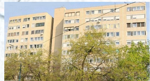
Az ingatlanról készült fénykép

Az épület összesített energetikai jellemzője az épület rendeltetés szerű használatának feltételeit biztosító épületgépészeti rendszerek egységnyi fűtött térfogatra vonatkozó, primer energiában kifejezett, kWh/(m 2 a) mértékegységű éves fogyasztása. Az összesített energetikai jellemző tartalmazza a fűtési, légtechnikai, melegvízellátási és (a lakóépületek kivételével) a világítási rendszereinek fogyasztását, beleértve e rendszerek hatásfokát és önfogyasztását.